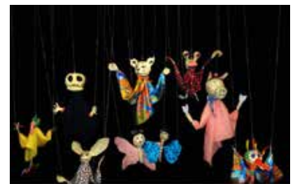
Workshop für Kinder - Kabarett Púpala Marionetten - Thomas Herfort Berlin

im Anschluß Kinderworkshop Marionette und Puppen aus Zeitungspapier und Krepp-Klebeband für verschiedene Altersstufen